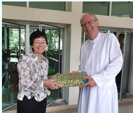
Happy Birthday จากคณะเซอร์ร้านบางแสน